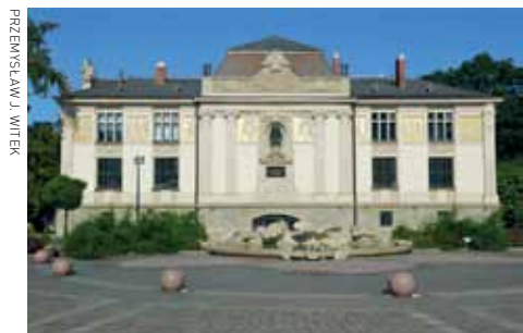
PREMIER SŁAW J. WITEK